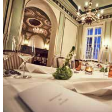
SALON IM RESTAURANT