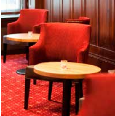
LOUNGE IM BISTRO